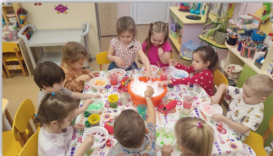
Опыт №2 «Почему тает снег»