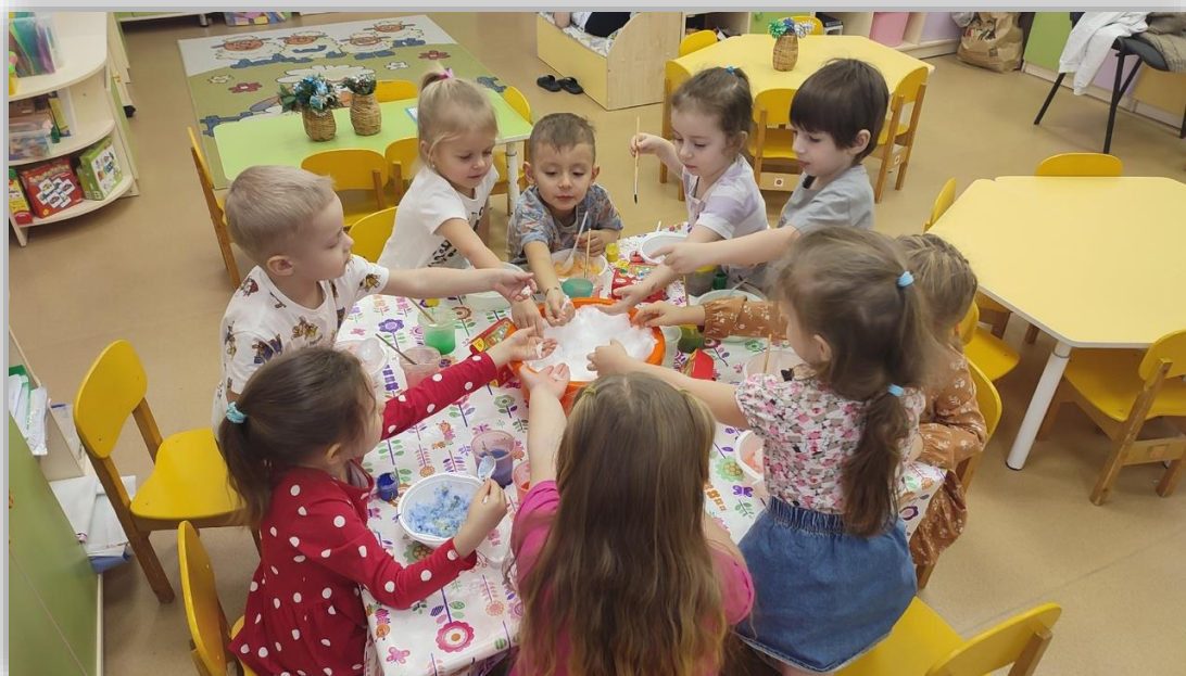
Опыт №3 «Разноцветные льдинки»