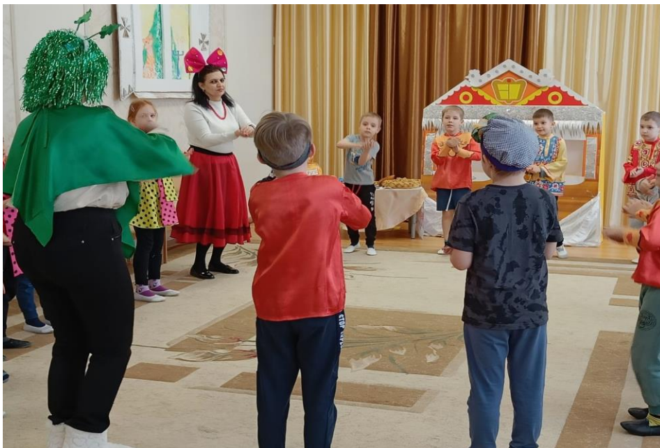
Развлечение «Коляда, коляда, отворяй ворота»