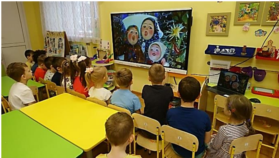
Просмотр фильмов о Старом Новом годе