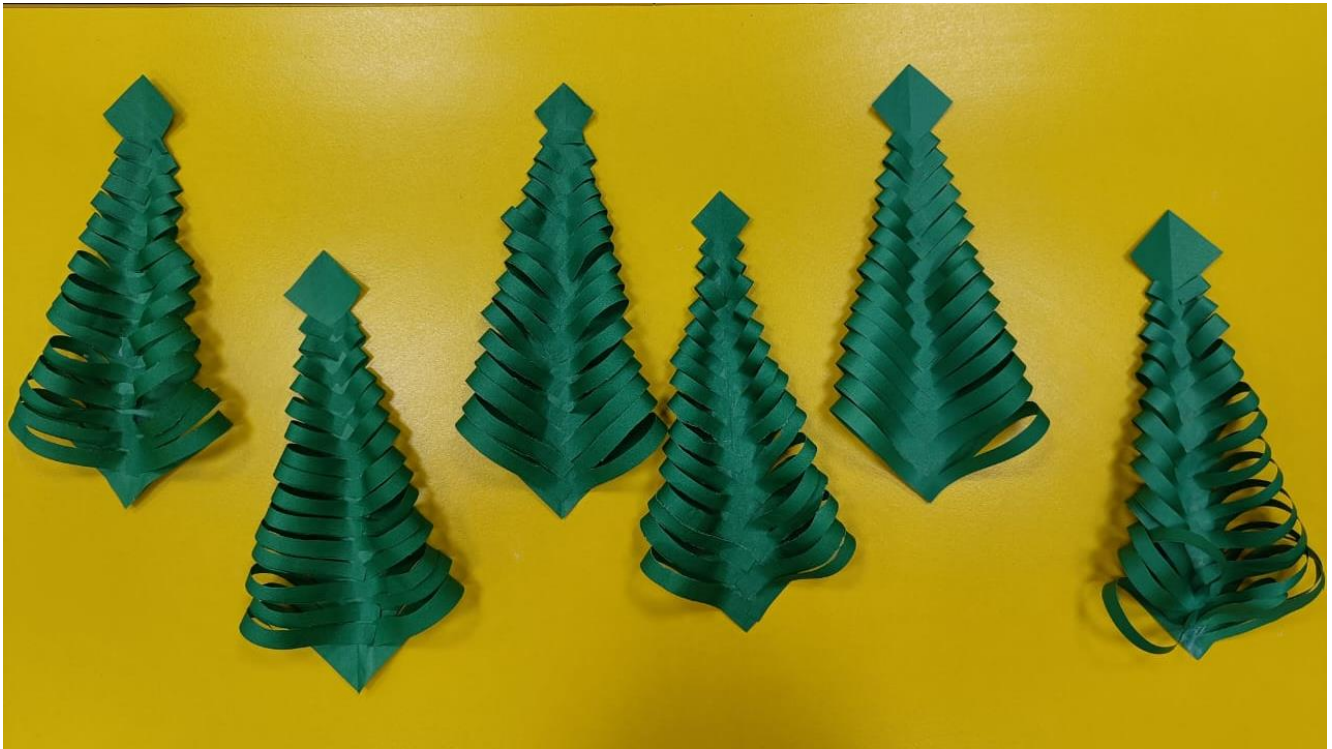
Поделки. Игрушки своими руками.