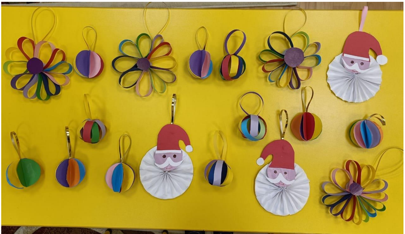
Рисование Зимушка -зима.