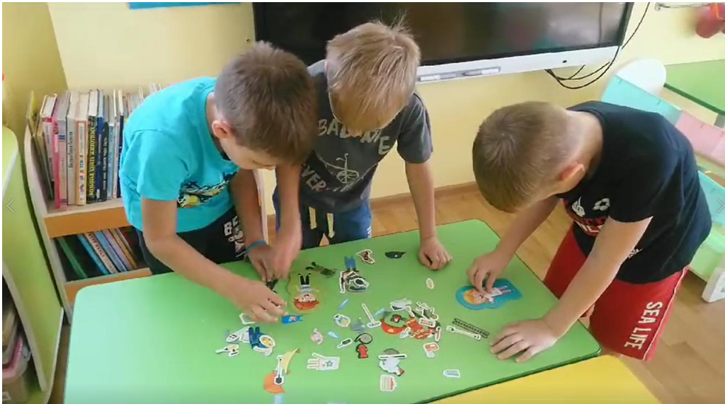
Сюжетно ролевые игры детей «Магазин»