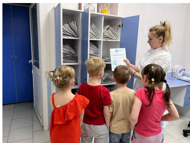
В медицинский кабинет