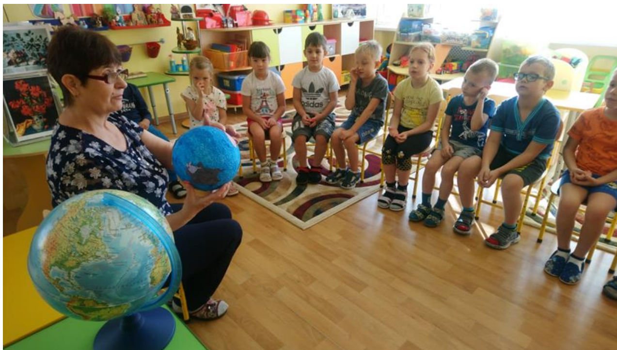
Пластелинлграфия «Материки Земли»»