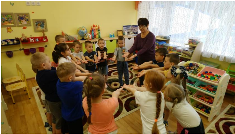
Подвижная игра «Дружная семья»